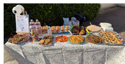
Vente de gâteaux devant l'école de Machault le vendredi 17 octobre